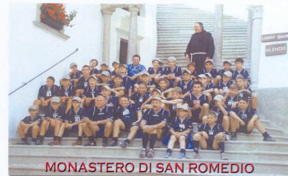
MONASTERO DI SAN ROMEDIO